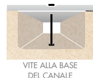
VITE ALLA BASE DEL CANALE

Descrizione Tecnica Griglia in acciaio zincato a ponte con alette copri bordo del canale Classe di carico A15 – secondo la normativa UNI EN 1433 Colore Grigio Tipo di disegno A fessure trasversali Fissaggio al canale Mediante n. 2 viti fissate verticalmente al fondo del canale Adatta al canale SELF 150 e SELF 150 P